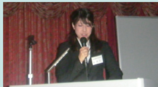
西鉄イン福岡13階ブロッコ